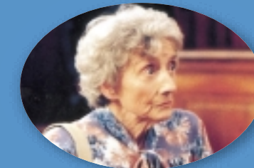
Suzanne Flon (La maîtresse d'école)

Cet avocat a une spécialité : faire acquitter tous ceux qui ont "une bonne raison" de tuer. Pour ce rôle, André Dussollier a retrouvé Jacques Villeret, son complice des Enfants du Marais , que Jean Becker avait déjà tourné en Rhône-Alpes.