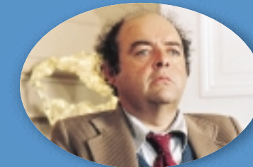
Jacques Villeret (Jojo Braconnier)

"Il était l'interprète idéal de ce personnage à la fois naïf, malheureux et déterminé lorsqu'il est poussé à bout. Il n'a pas son pareil pour faire rire et pour émouvoir en même temps."