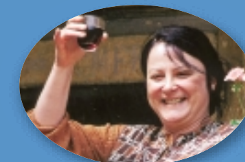
Josiane Balasko (Lulu Braconnier)

"Il était l'interprète idéal de ce personnage à la fois naïf, malheureux et déterminé lorsqu'il est poussé à bout. Il n'a pas son pareil pour faire rire et pour émouvoir en même temps."